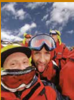
Gode opplevelser, utfordringer, aktivitet og sosialt fellesskap

Vi er også medlem av paraply organisasjonen Fagrådet – Rusfeltets hovedorganisasjon i Norge.