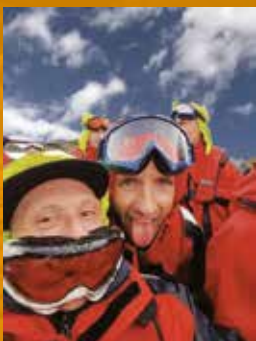
Gode opplevelser, utfordringer, aktivitet og sosialt fellesskap

Vi er også medlem av paraply organisasjonen Fagrådet – Rusfeltets hovedorganisasjon i Norge.